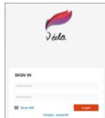
iPhone / iPad