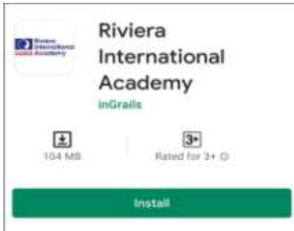
Play Store मा देखिने इमेज